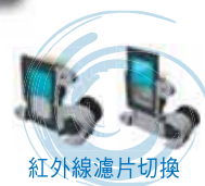
紅外線濾光片切換